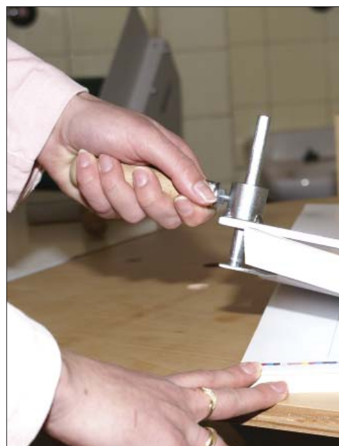
Protlačovačka na etikety